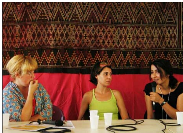
Dos artistas kurdas participan a un debate

Una animación para niños y adolescentes: un equipo que trabaja con la Casa de los jóvenes y de la cultura de Douarnenez propone, diariamente, talleres de creación, de cuentos y un acompañamiento a las proyecciones de cine.