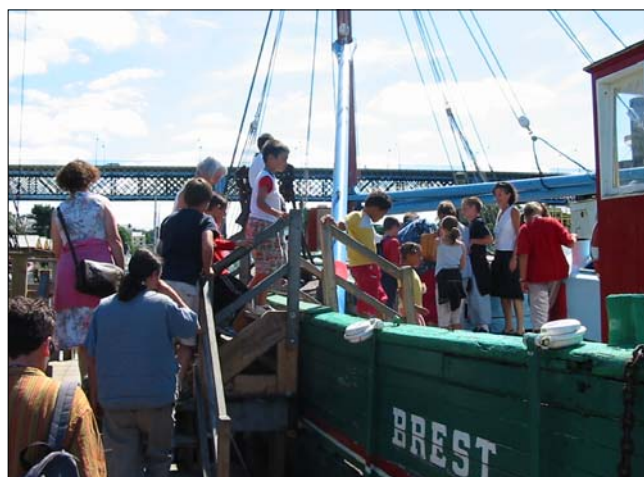
Niños yendo a una proyección en un barco

Una programación para niños de 3 a 12 años, que les permite descubrir un cine diferente que no se ve mucho en los circuitos habituales de difusión.