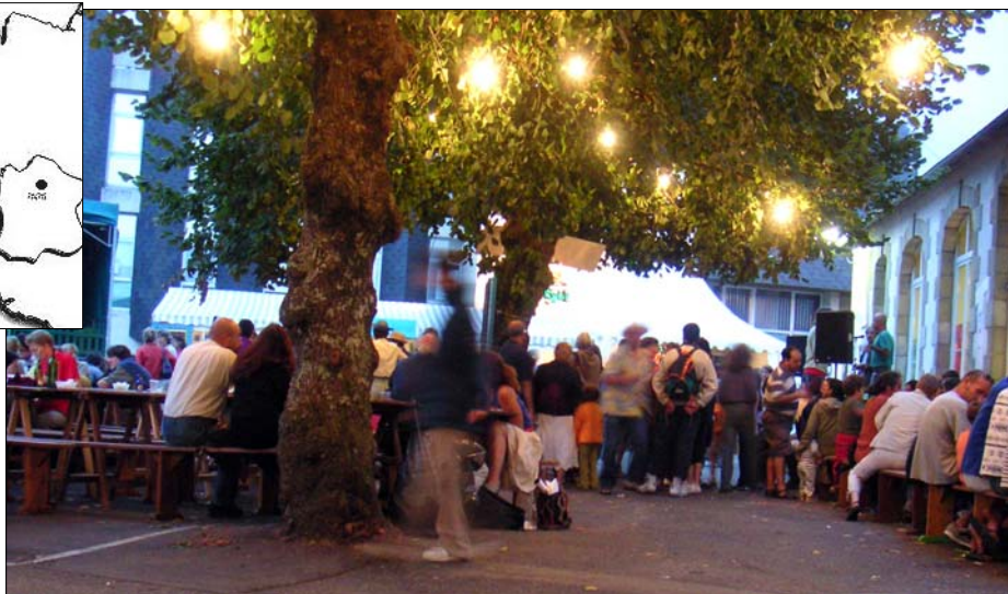
La plaza del festival en Douarnenez (Bretaña)